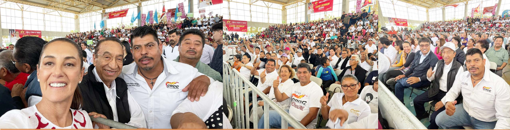
Acompañando a la Dra. Claudia Sheinbaum en su gira por Cabo San Lucas CROC BCS.