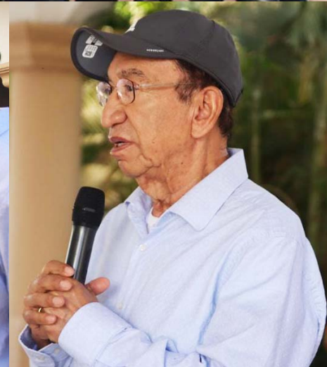
Reunión de trabajo con los compañeros transportistas en Cabo San Lucas.