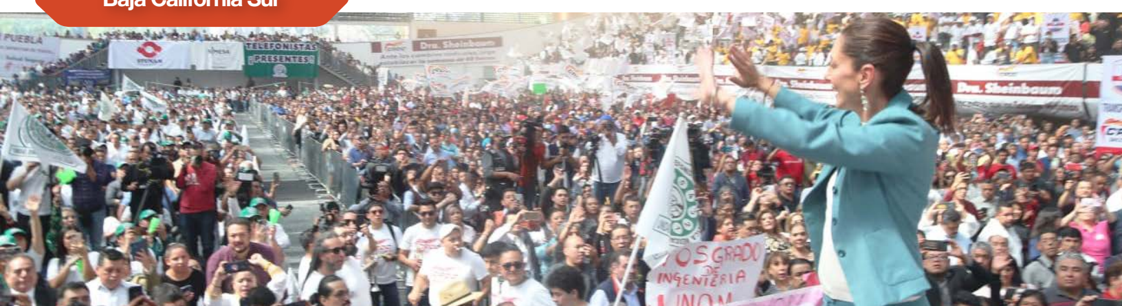
Se hace Historia en este gran Encuentro de la Mesa de Diálogo Sindical con la Dra. Claudia Sheinbaum, Coordinadora de Defensa de la Transformación. La CROC siempre en la lucha, haciendo mención de las necesidades de las y los trabajadores de nuestro País.