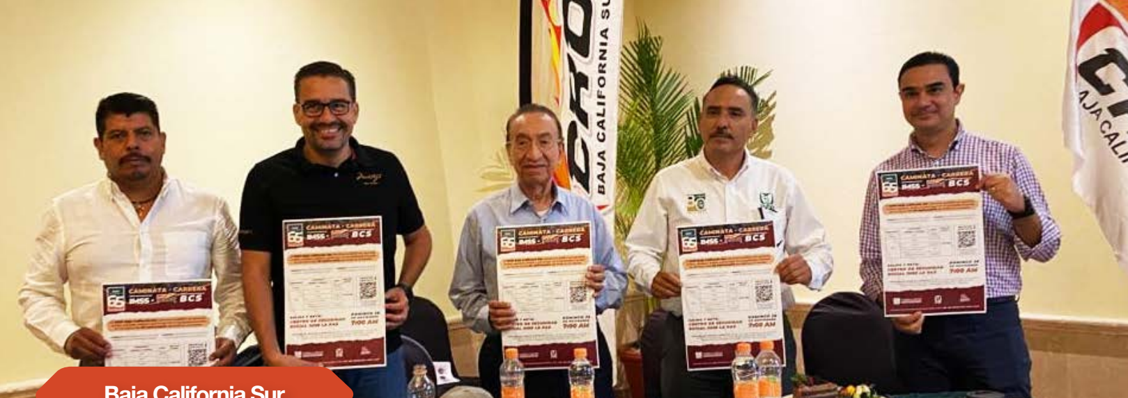
Baja California Sur