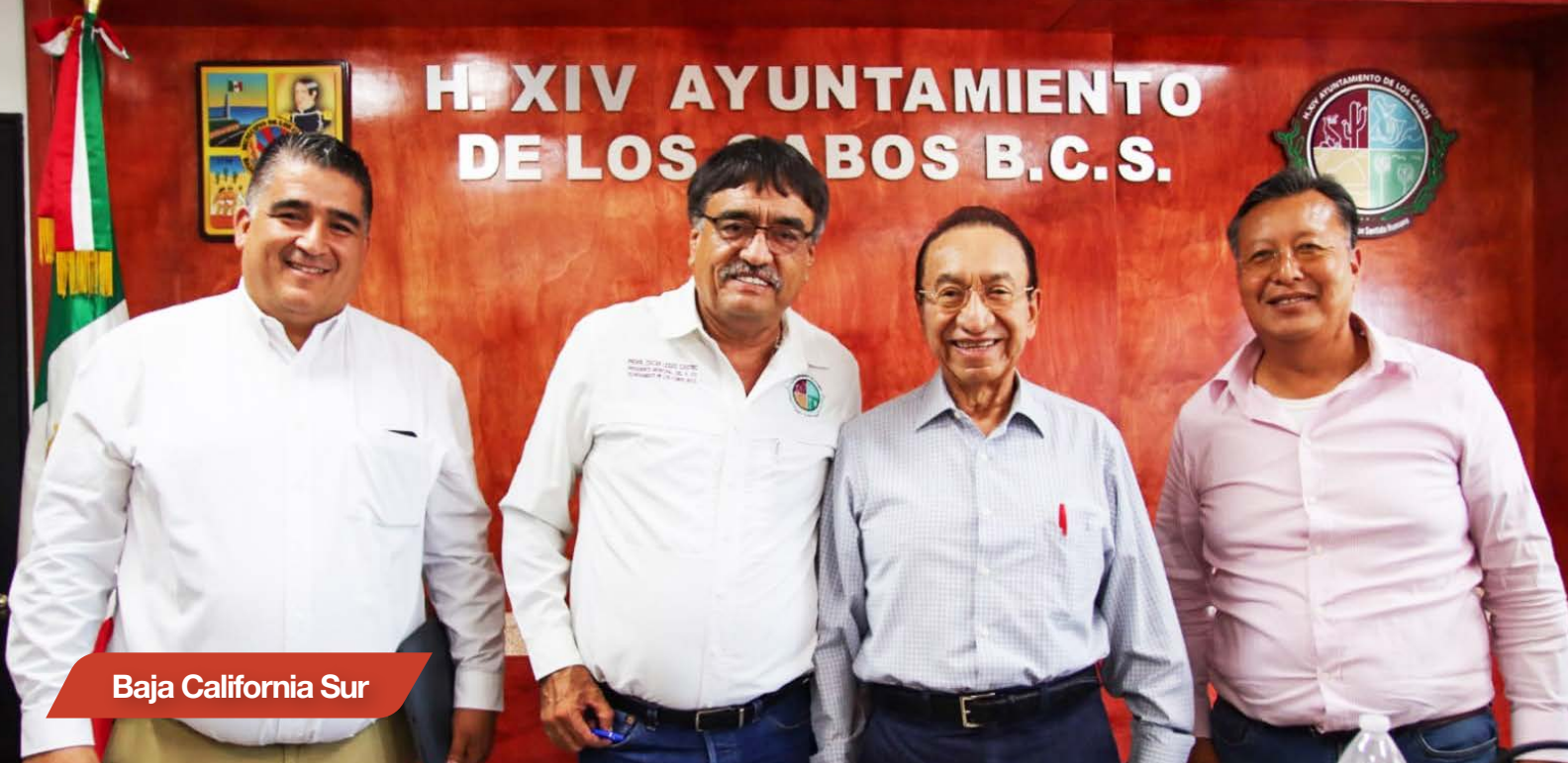
Baja California Sur