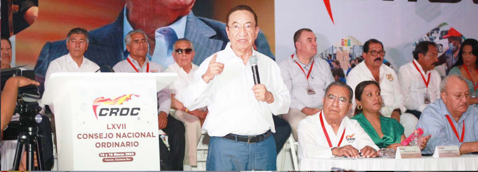
Gran Consejo Nacional Ordinario LXVII que se realizó en Cancún, Quintana Roo, con excelentes resultados dentro de cada una de las mesas de trabajo con el comité de profesionistas y técnicos, mujeres sindicalistas, el frente juvenil Sindicalista, y el área de mundo digital, la CROC siempre a la vanguardia.