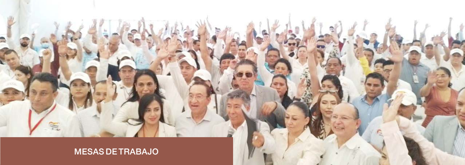
MESAS DE TRABAJO