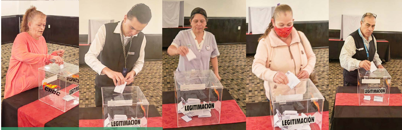
Legitimación Fiesta Inn Naucalpan