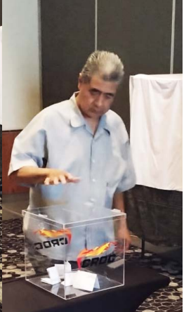
Legitimación Marriott Vallejo