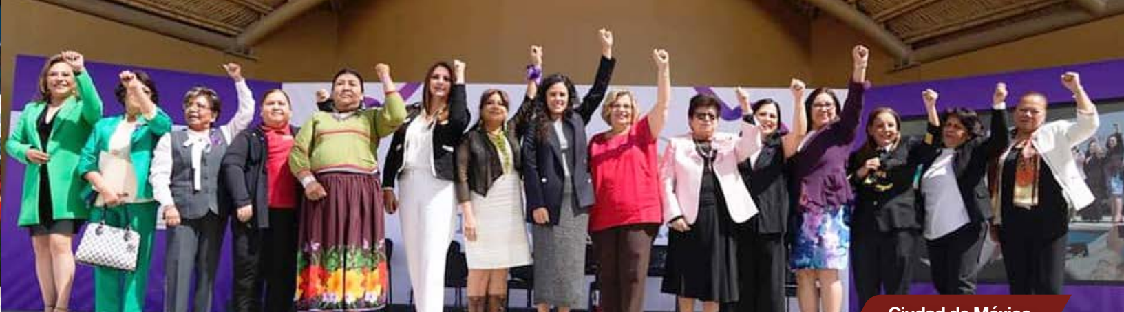
Ciudad de México