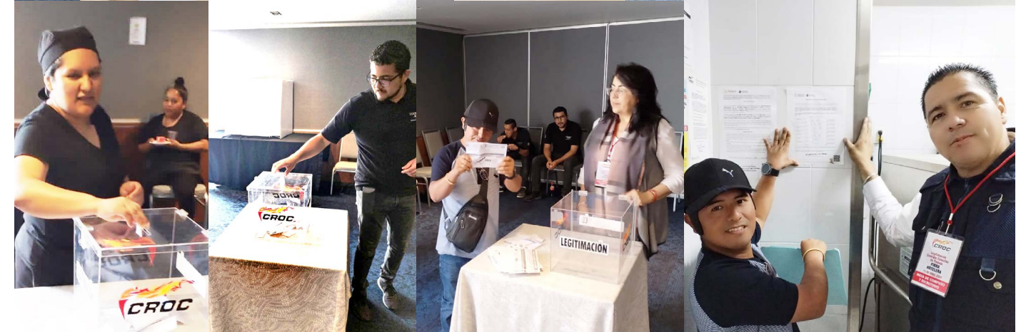
Legitimación Marriott Tereo