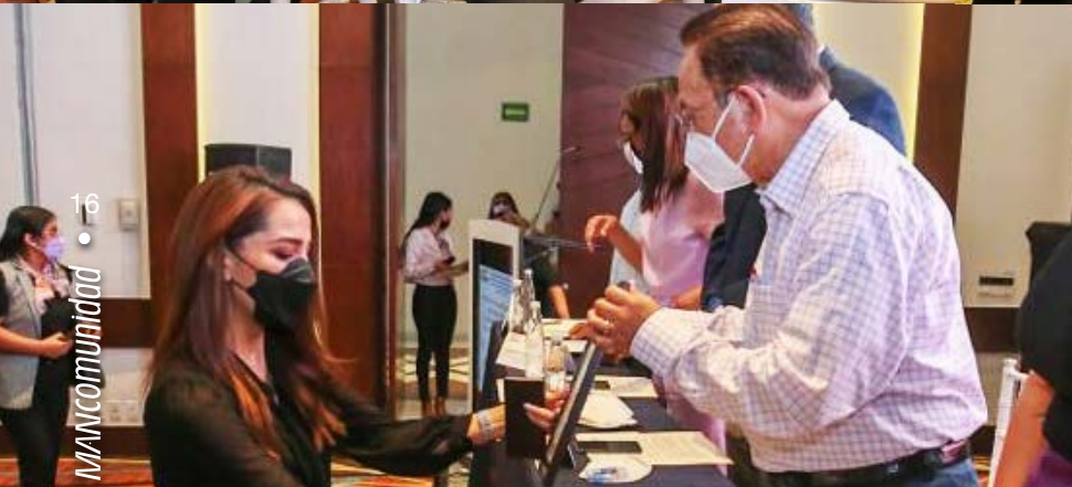
Gira de trabajo por León, Gto. Avanzamos y Entrega de Certificados de Legitimación.