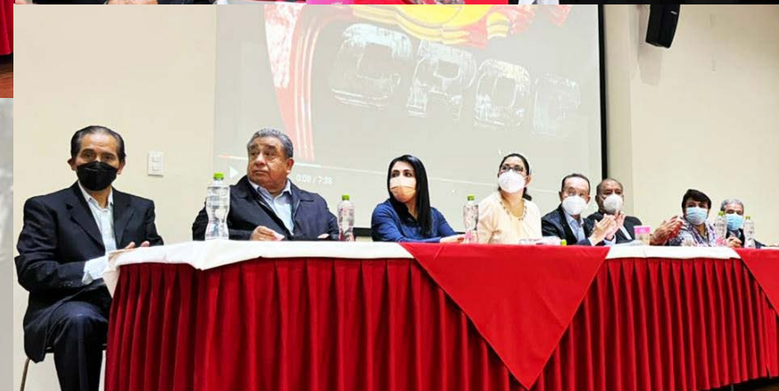
Porque la CROC siempre a la vanguardia en temas de capacitación se llevó a cabo la entrega de reconocimientos a todos los compañeros que realizaron el curso de Formación de Líderes Sindicales.