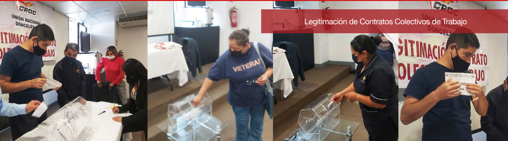
Legitimación de Contratos Colectivos de Trabajo