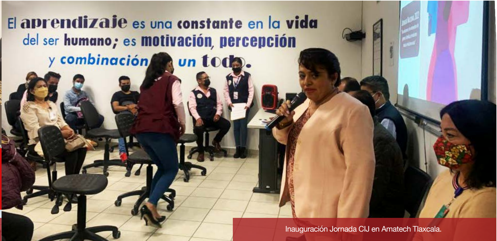
Inauguración Jornada CIJ en Amatech Tlaxcala.